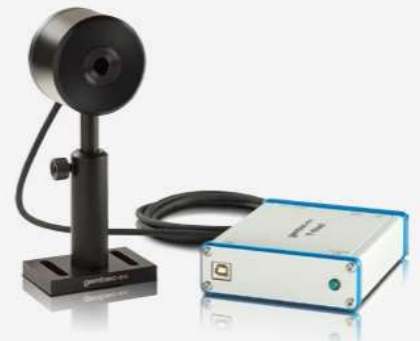
■ MESUREURS THZ