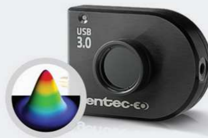
■ PROFILOMÉTRIE LASER