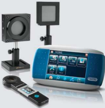
■ PUISSANCE ET ÉNERGIE LASER